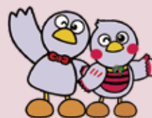
埼玉県のマスコット コバトン・さいたまっち

昭和 52 年から埼玉県職員として食品衛生行政の業務を行ってきました。 退官後は日本食品衛生協会の HACCP 普及指導員、東京都食品衛生協会の食品衛生コンサルタント部主席主幹、埼玉県食品衛生協会の専任講師、さいたま市食品衛生協会の専任講師、ノンピ (株) の衛生顧問として現在に至っています。